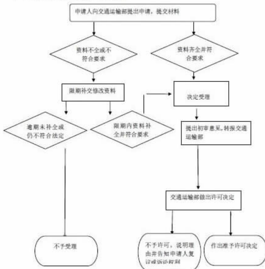
(二) 从事内地与港澳间海上运输